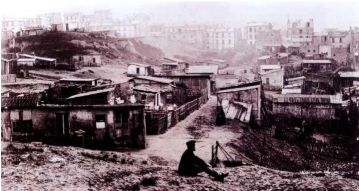
Photographie, rue Champlain, quartier Belleville, Paris avant 1860