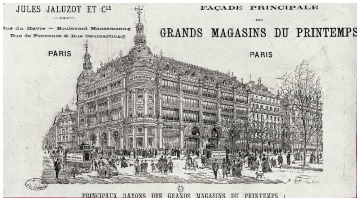
Façade principale des grands magasins du Printemps, Publicité vers 1883. BnF, Estampes et Photographie (Va 285 / 8)

Question 1 : présenter l'intérêt de ce document par rapport au sujet la ville au 19 e siècle.