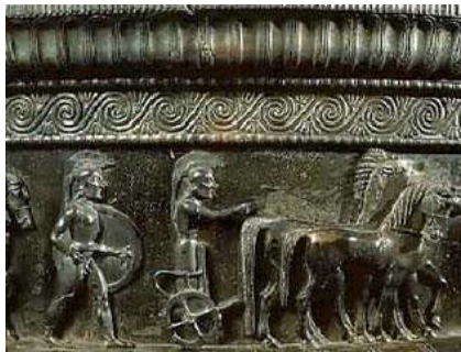
Photo : Cratère de Vix.