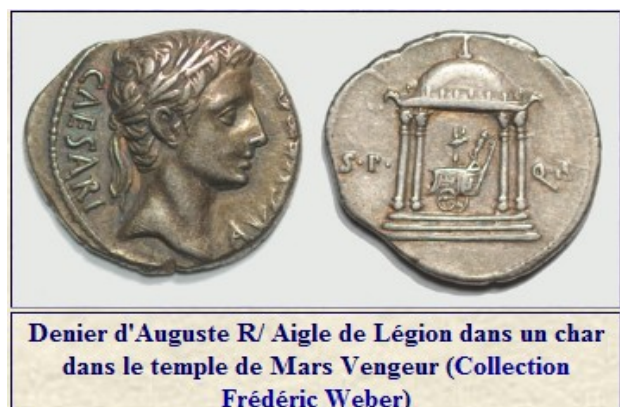
Denier d'Auguste R/ Aigle de Légion dans un char dans le temple de Mars Vengeur (Collection Frédéric Weber)