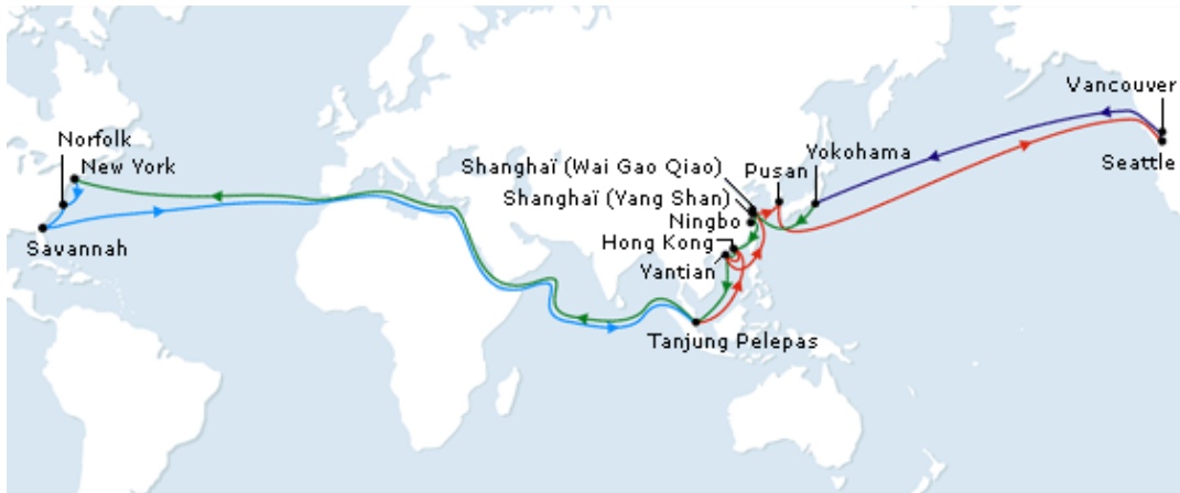
La ligne Columbus de la CMA-CGM.

14 Quelles régions du monde sont reliées par cette ligne et par la ligne Columbus ? Pourquoi à votre avis ?