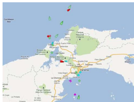
Canal de Panama (la nuit)

Conclusion : quelles régions du monde sont reliées par cette ligne ?