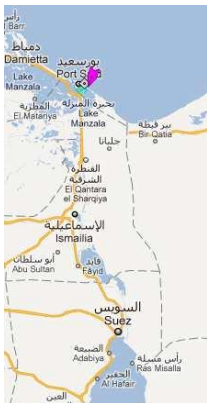
Canal de Suez