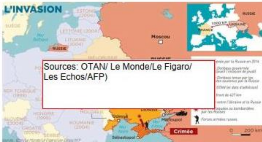
Document 1 : carte de l'invasion de l'Ukraine par l'armée russe.