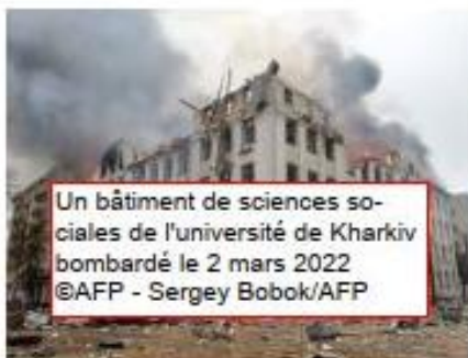
Un bâtiment de sciences sociales de l'université de Kharkiv bombardé le 2 mars 2022

4/ Observe les trois photographies ci-dessous. Légende-les pour expliquer quelles sont les conséquences de ce conflit en Ukraine.