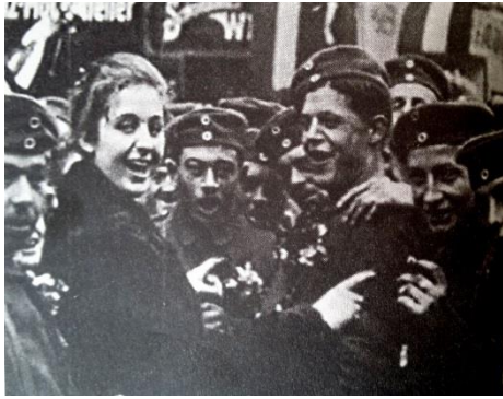
Document 1- Liesse à Berlin, le 11 novembre 1918, photo tiré d'un film retrouvé par l'historien français M.Ferro en 1963.

► Consigne 1 : Analyser les trois documents (1,2 et 3), qu'en pensez-vous ?