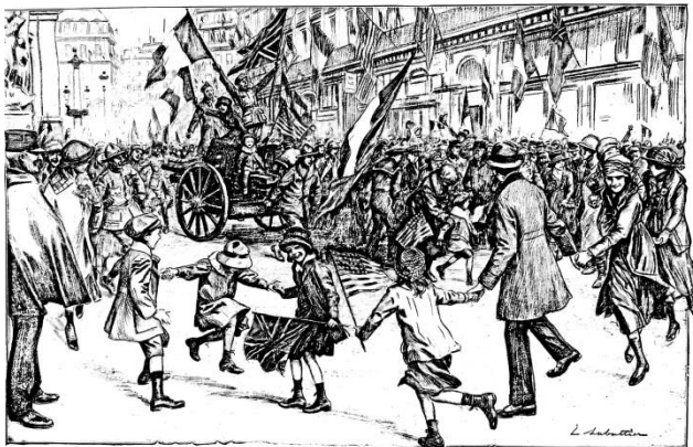
Document 3- La joie de Paris, le 11 novembre 1918, par le dessinateur L. Sabattier dans le journal l'illustration

Aide : l'illustration est un journal contemporain de ces événements.