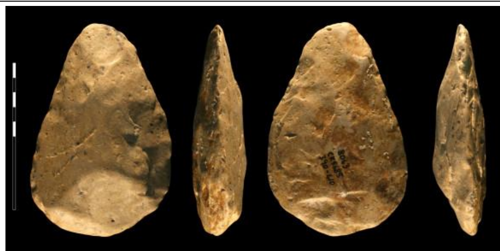
Source : biface, Canteen Kopje, Afrique du sud, 1 million d'années (voir le site : http://www.dayofarchaeology.com/il-y-a-plus-dun-million-dannees-des-experts-de-la-taille-de-pierre-a-canteen-kopje-en-afrique-du-sud/ ).