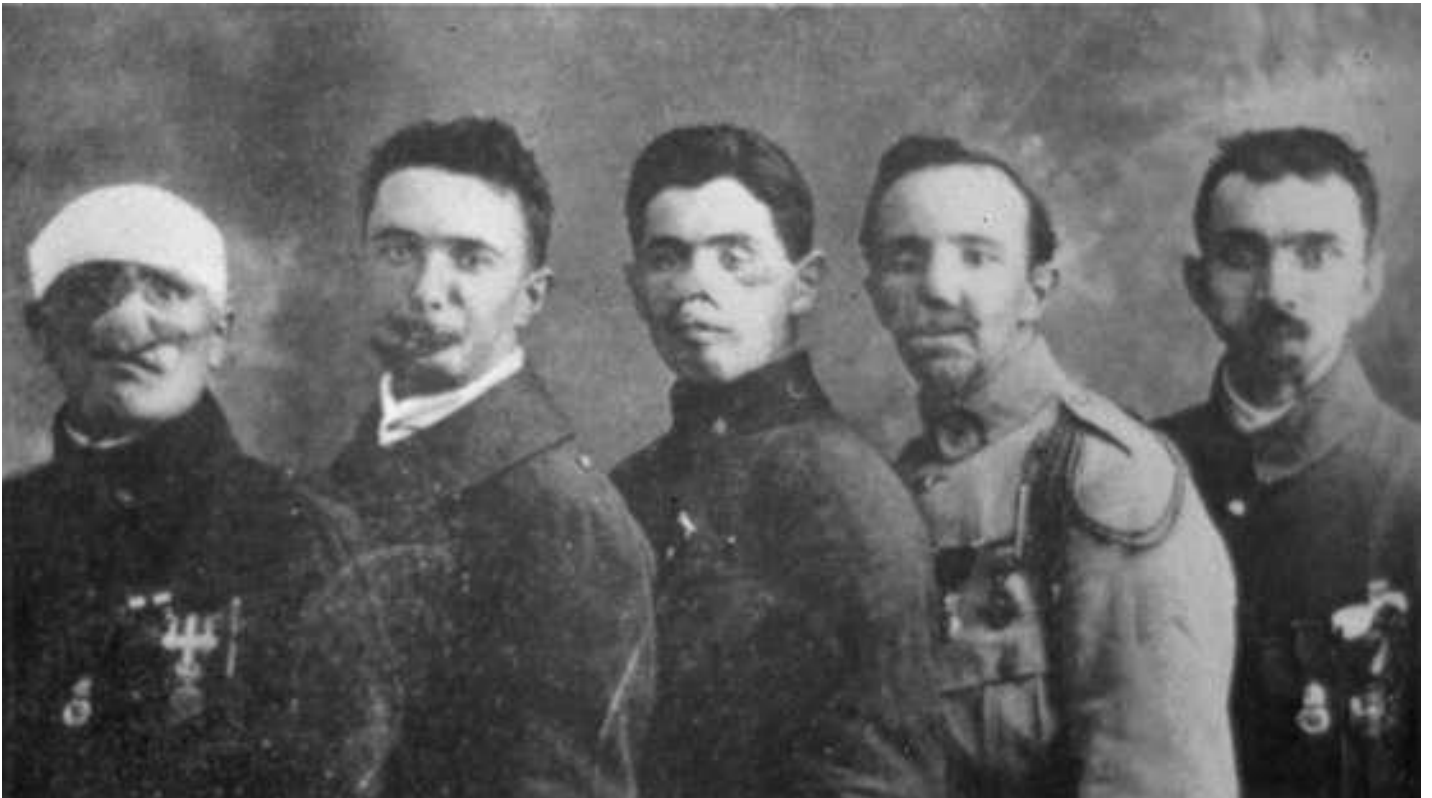
La délégation des gueules cassées à Versailles, le 28 juin 1919, photographie noir et blanc, auteur anonyme, Historial de la Grande Guerre de Péronne, France ( http://www.histoire-image.org/pleincadre/index.php?m=gueules%20cass%C3%A9es&d=1&i=112 ).