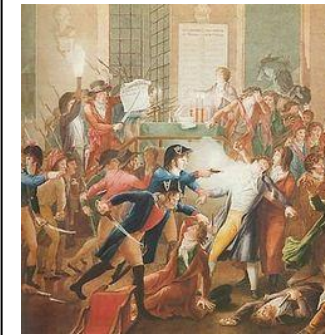
Robespierre : 28 juillet 1794

Fleurus : victoire des révolutionnaires le 26 juin 1794 (écarte définitivement les ennemis de la RF).