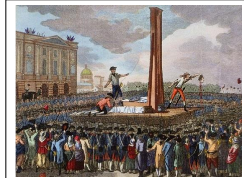
21 janvier 1793 : mort de Louis XVI.