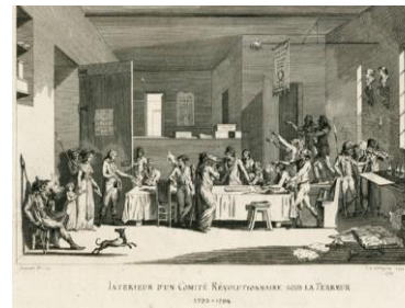
Comité révolutionnaire : 21 mars 1793