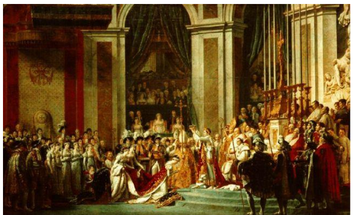
Sacre de Napoléon, par Jacques-Louis David

1795-1799 : Directoire ; persistance des difficultés financières