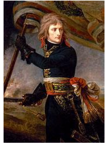
Napoléon au pont d'Arcole (Italie), par Antoine-Jean Gros 15-17 novembre 1796 bataille victorieuse

Après une courte période de paix, la guerre reprend. L'Angleterre, l'Autriche, la Prusse et la Russie s'allient contre la France. La flotte française est détruite à Trafalgar. Mais l'armée française remporte de brillantes victoires : Austerlitz, léna, Wagram.