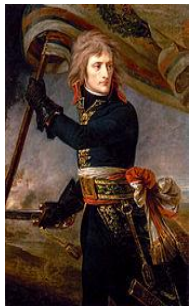
Napoléon au pont d'Arcole (Italie), par Antoine-Jean Gros 15-17 novembre 1796 bataille victorieuse

1795-1799 : Directoire ; persistance des difficultés financières