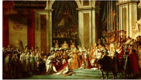
Sacre de Napoléon, par Jacques-Louis David

À partir des documents fournis, reconstitue la vie politique de Napoléon.