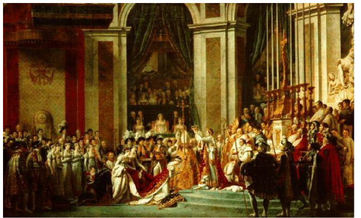
Sacre de Napoléon, par Jacques-Louis David

1795-1799 : Directoire ; persistance des difficultés financières