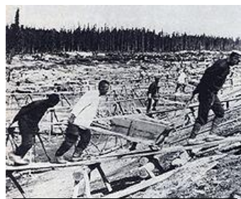
Un camp de travail forcé dans le nord de la Russie