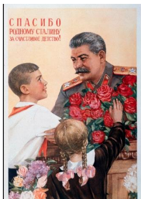
Merci à notre cher Staline pour notre enfance heureuse.