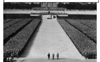
Congrès de Nuremberg