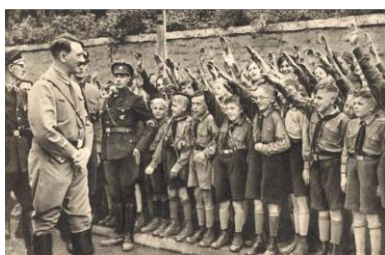
Des jeunes saluent Hitler