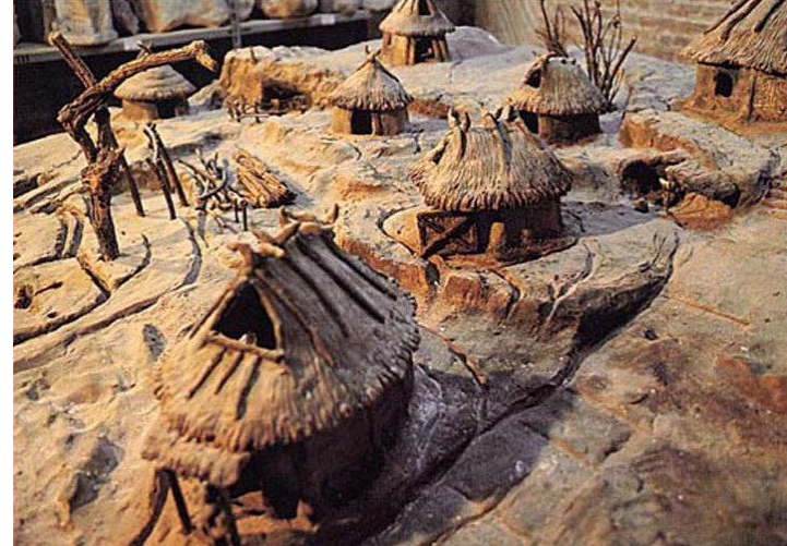
Document 1 : Reconstitution des cabanes à Rome, musée Palatin, Rome, VIIIe siècle av. J.-C.

Question 2 : Comment se nomme ce type d'histoire ?