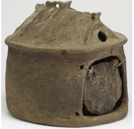
Doc 2 Une urne funéraire (on y met les cendres d'un défunt) représentant une cabane, découvert par les archéologues.