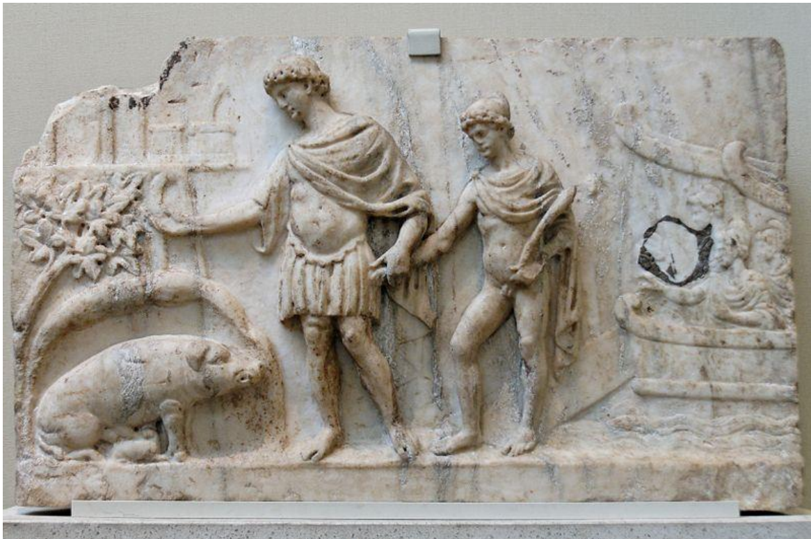
Photo de J.Astrow prise 2007 Source : https://fr.vikidia.org/wiki/%C3%89n%C3%A9e