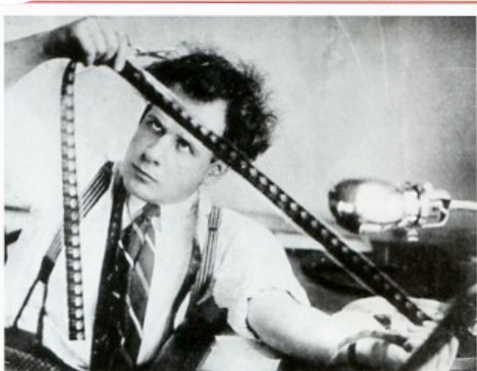
Sergueï Mikhaïlovitch Eisenstein (1898-1948)

Sergueï Mikhaïlovitch Eisenstein est né à Riga en 1898, dans une famille bourgeoise. En 1917, il s'engage dans l'Armée rouge. À la fin de la guerre civile, il devient décorateur et metteur en scène de théâtre. Son premier film, La Grève (1925), le rend célèbre. Il a alors 27 ans. Par la suite, il réalise de nombreux chefs-d'œuvre : Le Cuirassé Potemkine (1925), Octobre (1927), La Ligne générale (1929), Alexandre Nevski (1938) et Ivan le Terrible (en deux parties, 1942-1946).