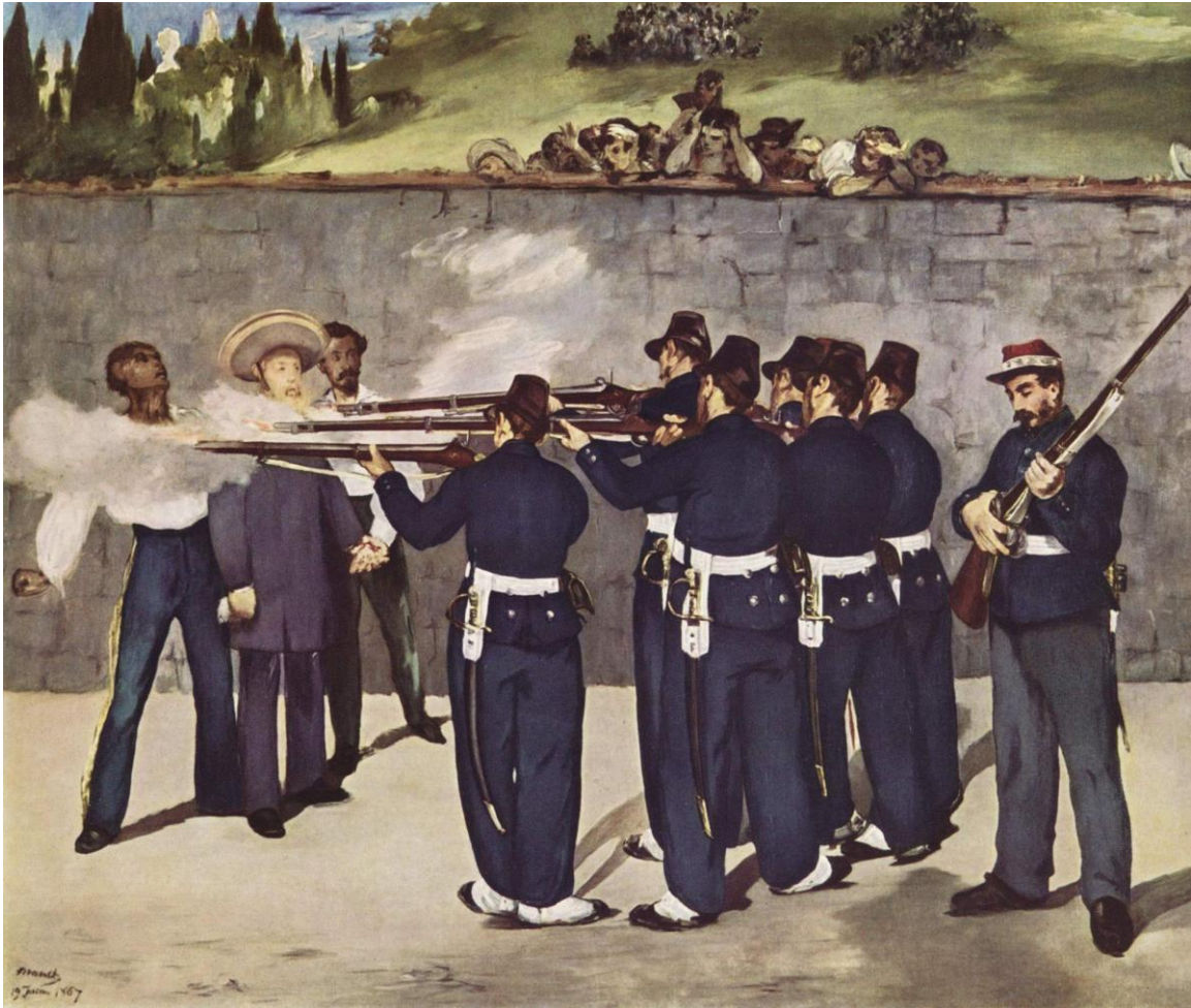
Edouard Manet, L'Exécution de Maximilien , 1868, huile sur toile, 2 m 52 x 3 m 05, Städtische Kunsthalle, Mannheim (Allemagne).