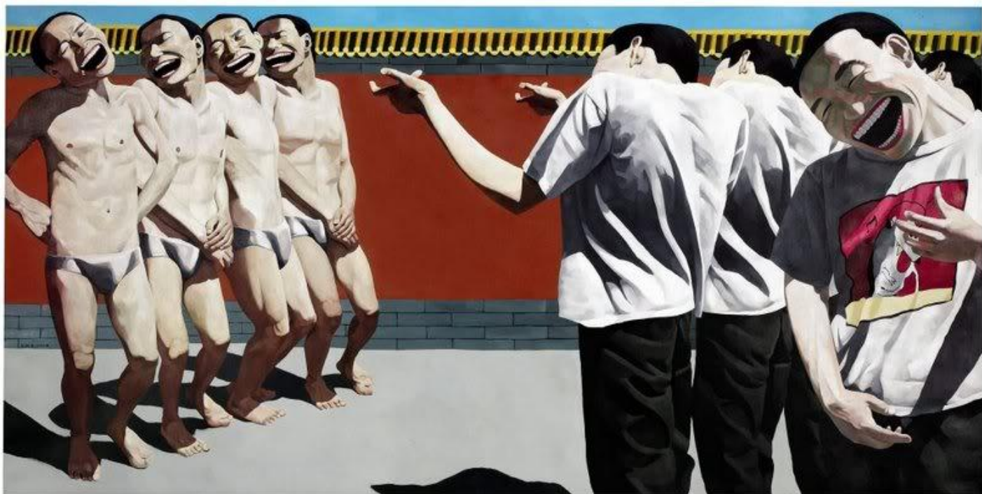
Yue Minjun, Execution , 1995 , huile sur toile, 1 m 50 x 3 m, collection particulière.