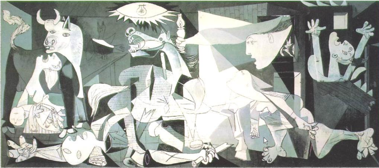
Guernica. Huile sur toile ; 3,51 x 7,52 m ; Musée national Reina Sofia, Madrid