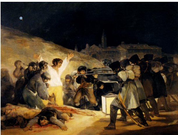
GOYA Tres de Mayo