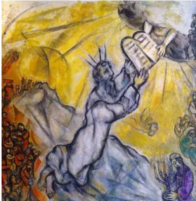
Document 1 : Marc Chagall (1887-1985) Moïse recevant les Tables de la Loi (1960-1966) Musée Marc Chagall, Nice

Consigne : Observer les documents (penser à zoomer) et lire le tableau puis lire et répondre aux questions.