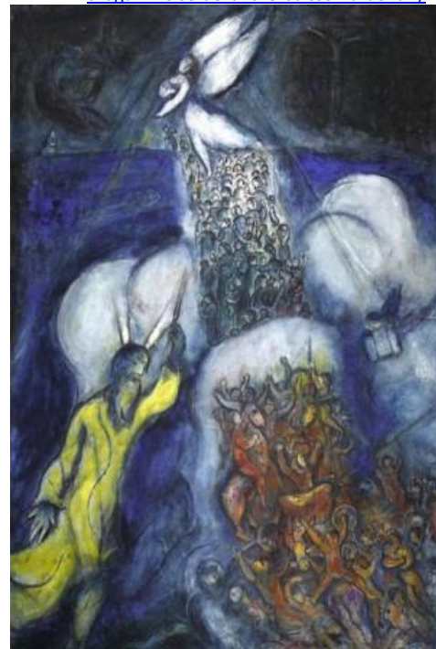
Document 3 : Marc Chagall (1887-1985) La Traversée de la Mer Rouge (1955) Musée Marc Chagall, Nice

Source : https://leblogdephil.com/2016/05/20/marc-chagall-moise-devant-le-buisson-ardent-2/