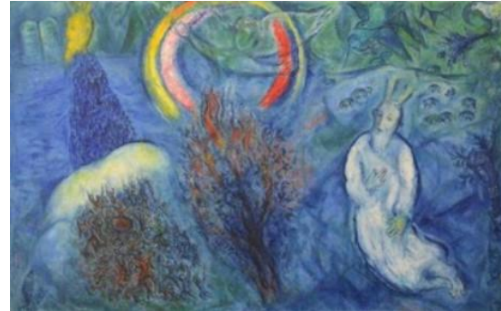
Document 2 : Marc Chagall (1887-1985) Moïse devant le buisson ardent (1960-1966) Musée Marc Chagall, Nice

Source : https://leblogdephil.com/2016/05/20/marc-chagall-moise-recevant-les-tables-de-la-loi/